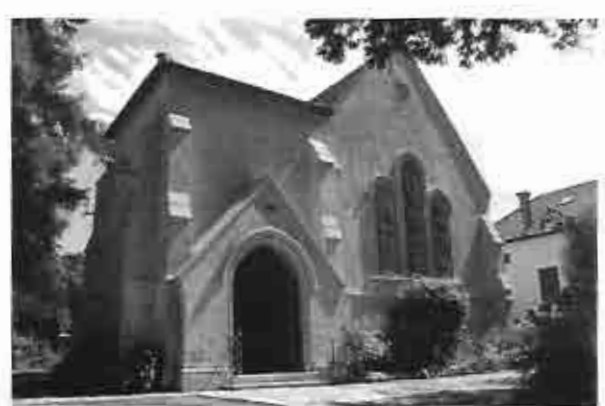
Enero - Febrero 2013 / 9