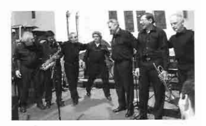
pidió el 2012. Esta es la Gospel Jazz Band, un grupo de excelentes músicos, con talentos, alegría y huen humor, pero por sobre todas las cosas, un Gran Dios que es el invitado especial en cada concierto.

El humor de los músicos es una característica de La Gospel Jazz Band. Entre chistes y música las risas nunca faltan, algo poco frecuente en los conciertos de jazz. Estos conciertos son dados en la capilla de Belgrano desde 2004. De esta manera, al igual que todos los segundos viernes de los meses pares, la banda des-