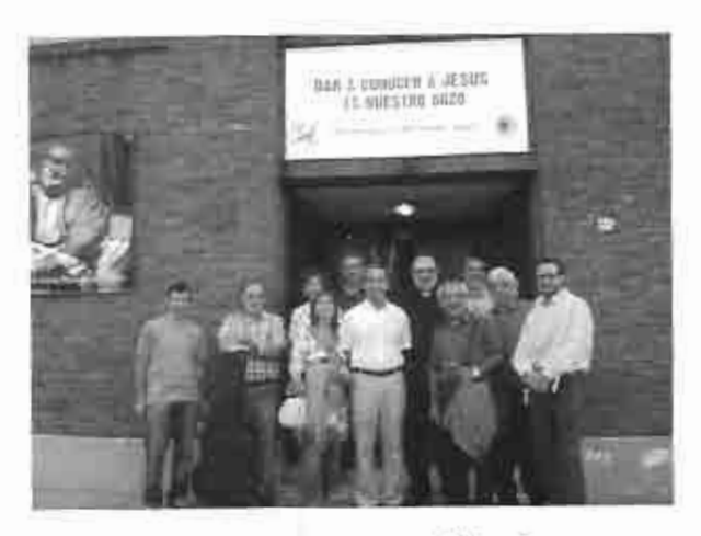
Reunión Ecuménica en diciembre