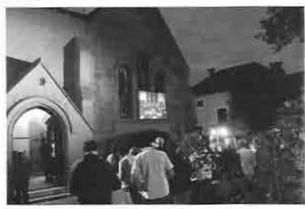
Enero - Febrero 2013 / 5