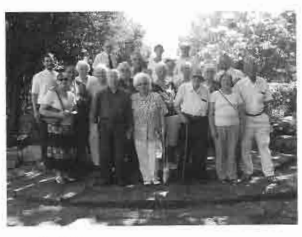
Congregación del Culto de 9:00 a 10:00